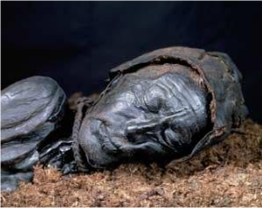
Moselig: Tollundmanden, død ca. 400 år f.kr.

Hvornår begyndte Danmark at være Danmark? Man kan møde de gamle indbyggere på den danske jord på museer rundt om i landet – Danmark var dengang fuld af moser, og en del mennesker endte deres liv der. Moserne bevarer biologisk materiale godt og mosefundene er en vigtig kilde til at forstå, hvordan man levede dengang.